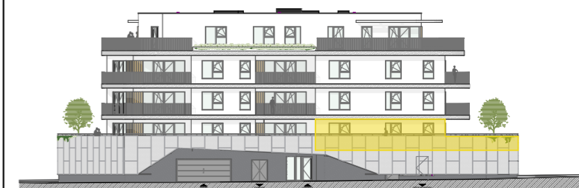
Façade Avenue Albert 1er