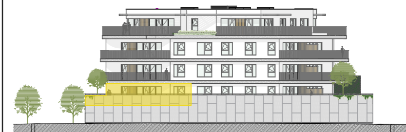
Façade Petite Rue à l'Art